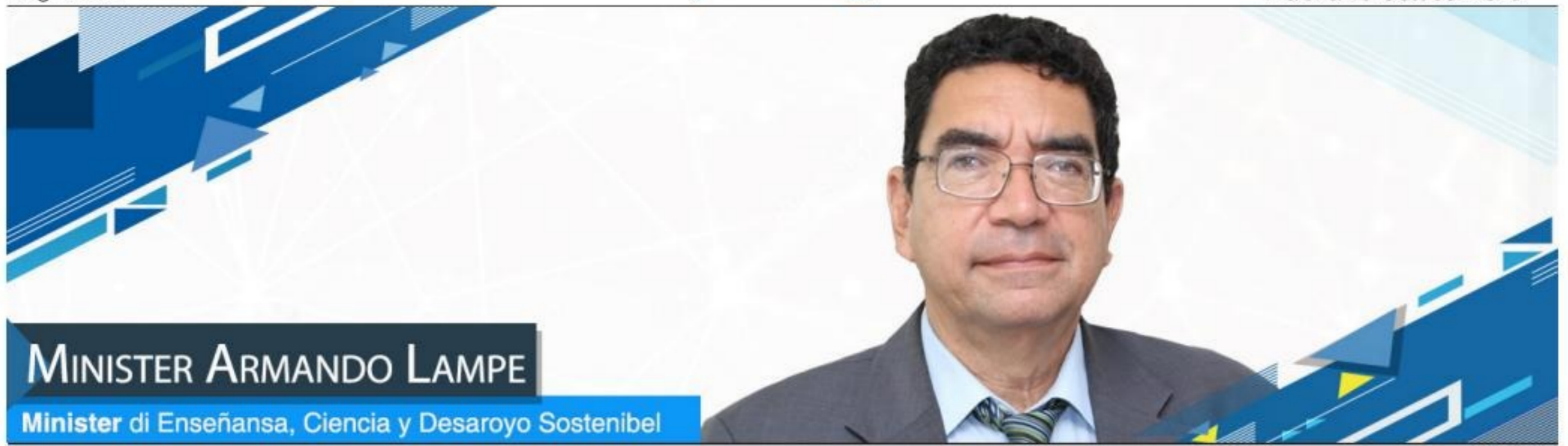
MINISTER ARMANDO LAMPE

Minister di Enseñansa, Ciencia y Desaroyo Sostenibel